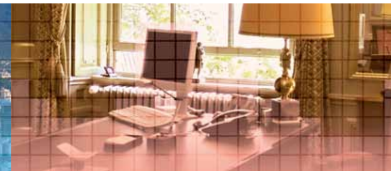
Банк управления частным капиталом