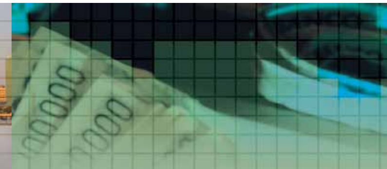
Банк микрофинансирования и кредитные товарищества